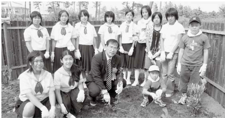
町長も子どもたちと一緒に植樹しました

この小径は、住民の方や一宮町を訪れた方々が 四季の花を楽しめるようになっていて、今の時期 は、アペリア、サザンカ、シユウメイギクなどの 花が咲いています。さわやかな秋を迎え、散歩や ウォーキングに絶好の季節です。自然の中で木々 や花々に親しむ時間を過ごしてみたいかがでし ようか。