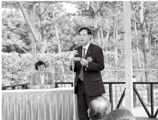
贈呈式であいさつをする町長

この小径は、住民の方や一宮町を訪れた方々が 四季の花を楽しめるようになっていて、今の時期 は、アペリア、サザンカ、シユウメイギクなどの 花が咲いています。さわやかな秋を迎え、散歩や ウォーキングに絶好の季節です。自然の中で木々 や花々に親しむ時間を過ごしてみたいかがでし ようか。