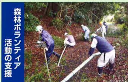
森林ボランティア活動の支援

未来のみどりは僕たち私たちが守り育てます 第35回緑の少年団交流集会・体験林業(大多喜町)