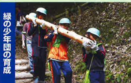
緑の少年団の育成

緑の募金は身近な環境の緑化から、森林の整備、緑の普及啓発事業、森林環境学習など様々な緑化事業に役立っています。(写真はその一例です)