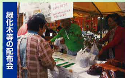
緑化木等の配布会

ボランティアによる森づくりを応援します 県民参加による緑の再生事業・学校林の整備(佐倉市)