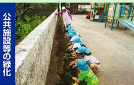
公共施設等の緑化

家庭からのみどりづくりを推進 栄町産業まつり・印旛地域農林業PRコーナーでの配布(栄町)