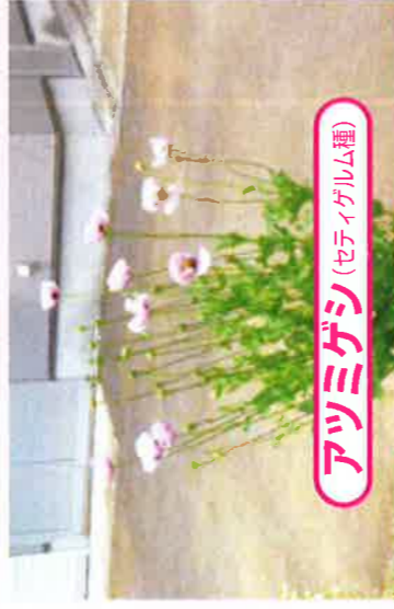
アツミゲシ (セティゲルム種)

花びら4枚で、色は赤、桃、紫、白などがあります。また、多数の花びらがついた八重咲きの花もあります。