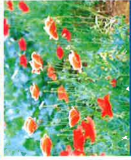
ヒナゲシ(虞美人草)