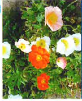
アイスランドポピー