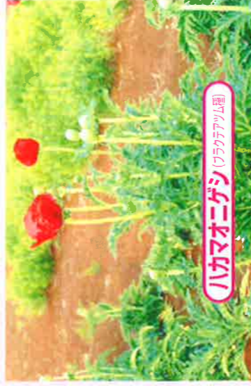
ハカマオニゲシ (ワラゲアム種)