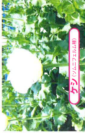
ケシ (ソムニフェルム種)