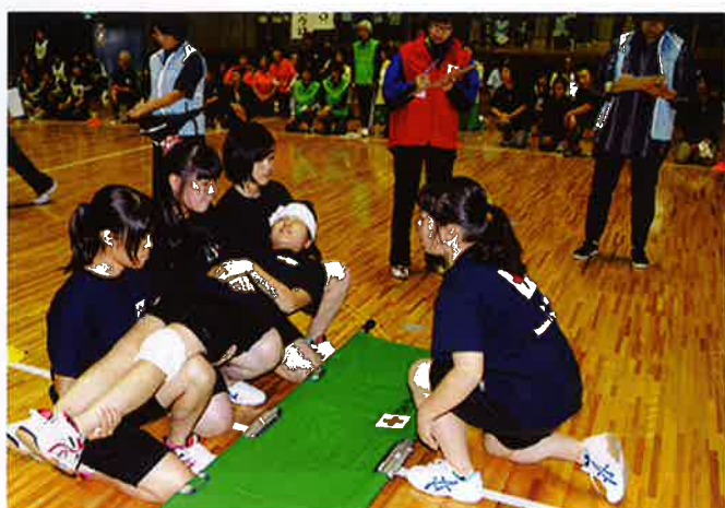
友達を助ける技術を学びます(救急法フェスタ)