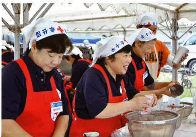
被災者にあたかな食事を届けます(九都県市防災訓練)