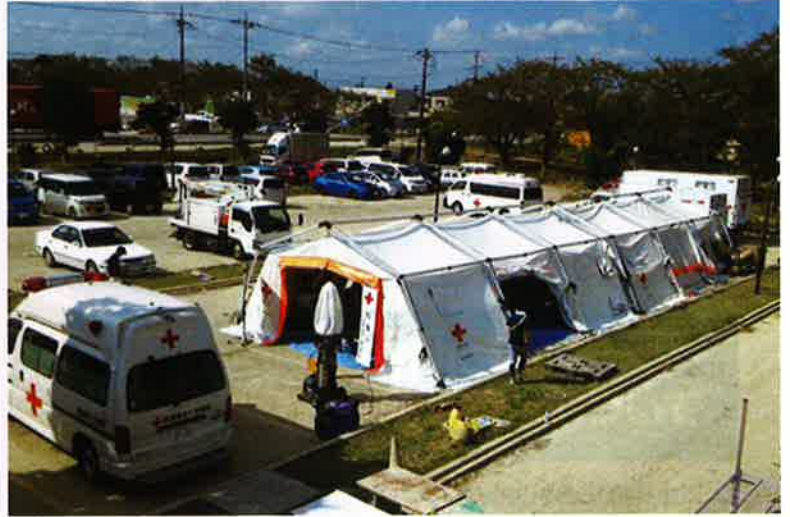
平成27年 台風第18号等大雨災害

日本赤十字社が実施する国内の災害救護活動、 救急法などの講習普及事業、青少年赤十字活動、 国際救援活動など様々な活動は、国や県などの補助金によらず、赤十字の活動にご賛同いただいた皆様からの社費や寄付金によって実施されています。