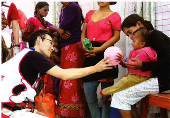
国外の災害でも迅速に支援を行います(平成27年ネパール地震)