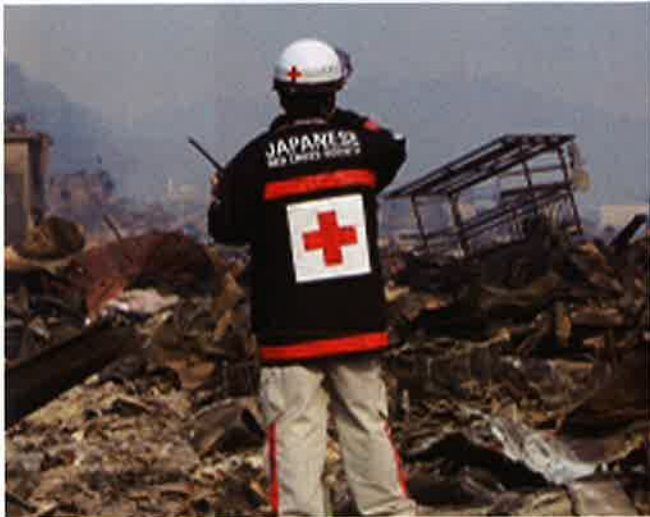
平成23年 東日本大震災

日本赤十字社は、常に社会のあらゆるシーンに目を向け、救いを必要とする人々のために人道的支援活動を展開しています。