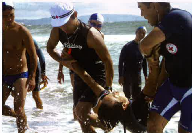
いのちと健康を守る知識を伝えます(水上安全法)