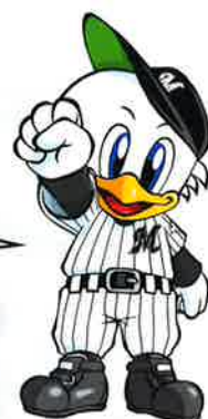
マークくん