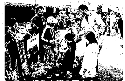
● 緑化木等の配布会 ●