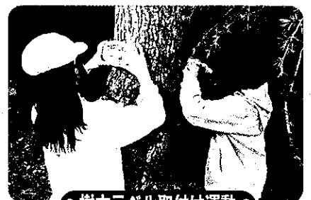
● 樹木ラベル取付け運動 ●