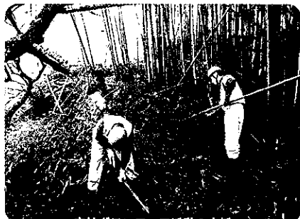
● 森林ボランティア活動の支援 ●