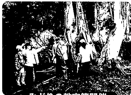
● みどりの教室等開催 ●