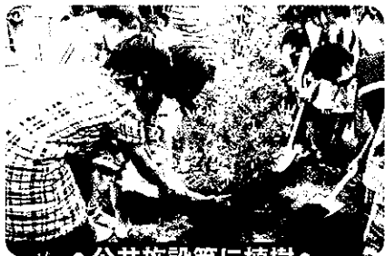
● 公共施設等に植樹 ●

緑の募金は身近な環境の緑化から、森林の整備、緑の普及啓発事業、森林環境学習など様々な緑化事業に役立っています。