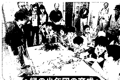
● 緑の少年団の育成 ●