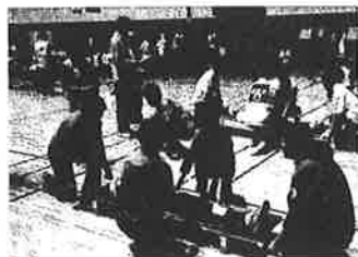
日赤奉仕団の活動