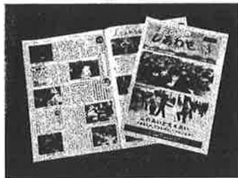
福祉広報「しあわせ」