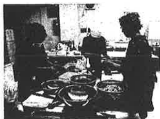
福祉ボランティア活動