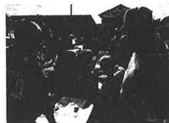
災害ボランティア立上げ訓練