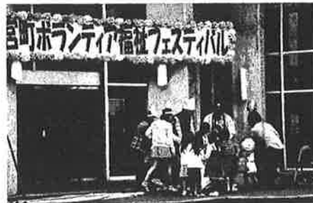
ボランティア福祉フェスティバル開催