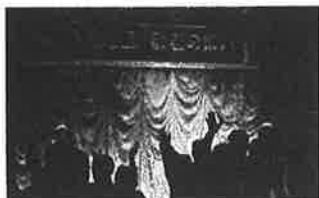
地区社協敬老のつどい