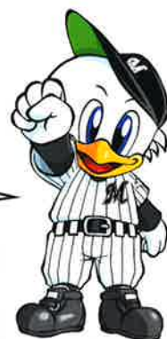
マークくん © CLM.