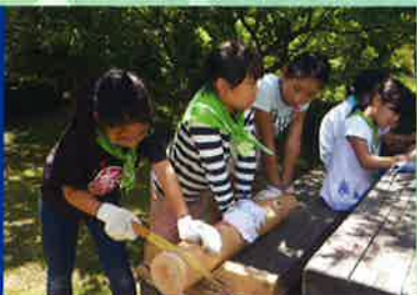
未来のみどりは僕たち私たちが守り育てます 第36回緑の少年団交流集会(大多喜町)