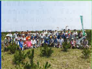
ボランティアによる森づくりを応援します 県民参加による緑の再生事業・海岸林の下刈(匝瑳市)