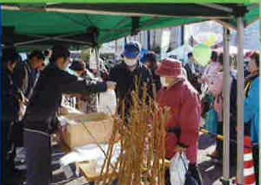
家庭からのみどりづくりを推進 長生村産業まつりでの苗木配布会(長生村)