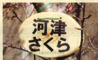
▲間伐材を利用した樹木ラベルの配布(配布先は小・中学校等)