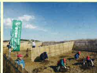
旭復興事業 2016 (旭市)