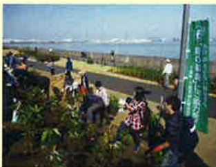
うらやす絆の森・植樹祭(浦安市)