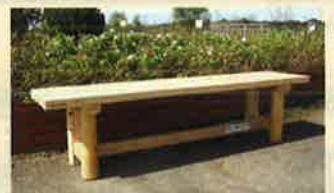
▲木製ベンチの設置(旭市・川口沼親水公園)