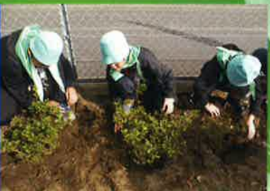
私たちの街にみどりをありがとう 豊海小学校ツツジ植樹(九十九里町)