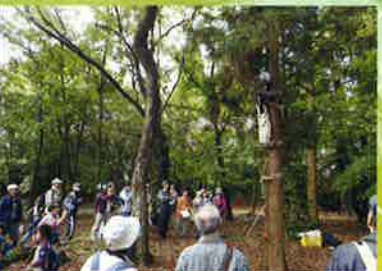
みどりの重要性を普及・啓発します 佐倉の秋なんでも観察会(佐倉市)