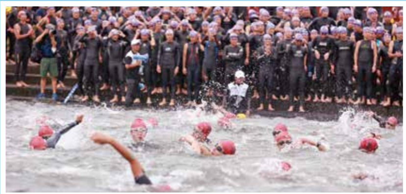
①スイム 1.5km 一宮川河口

昨年に続き、今年も一宮町で九十九里トライアスロン(99T)を行います。 この大会は、スイム・バイク・ランの3種目とも九十九里の海岸線で行われるという最高のロケーションにより、昨年は2101人の参加者が集まり、日本最大規模の大会となりました。 今年も、2200人の参加者を予定しています。