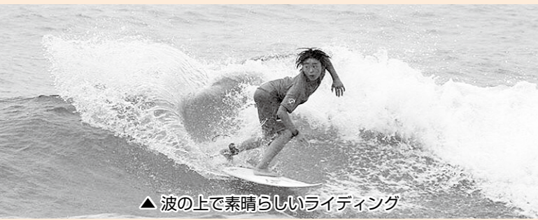
▲波の上で素晴らしいライディング