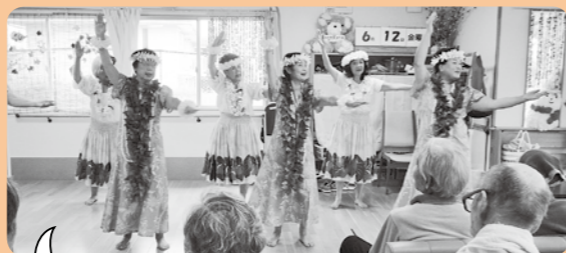
それぞれの持ち味を生かして施設での演芸発表や障害者スポーツ大会のお手伝いなど様々なボランティア活動をしているよ。