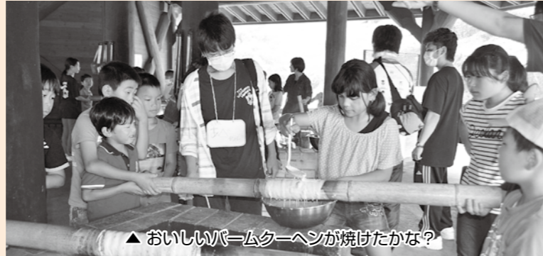
▲おいしいバームクーヘンが焼けたかな?

今回は、夏のキャンプの事前研修を兼ねて、さまざまなレクリエーションを体験。クライミングウォールやバームクーヘン作りなどを楽しみました。