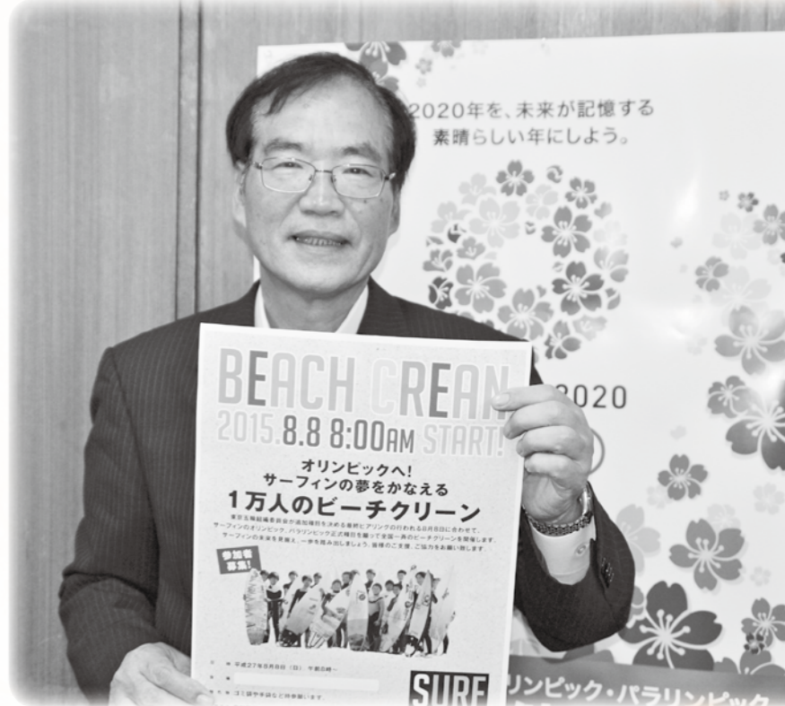
BEACH CREAM 2020 2015.8.8 8:00AM START! オリンピックへ！ サーフィンの夢をかなえる 1万人のビーチクリーン