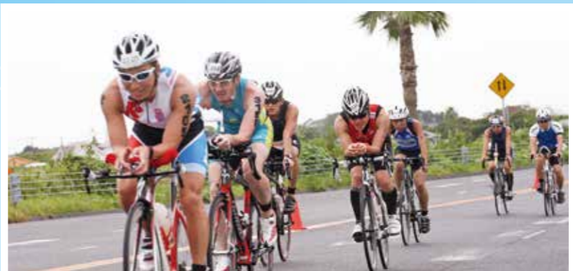
②バイク 40km 東金九十九里有料道路を全面封鎖したフラットコース