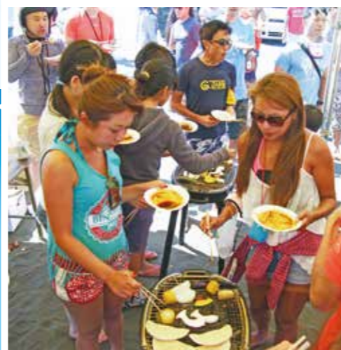
★ビーチサイドパーティ フィニッシュ会場にて、サンセットと共に 地元名物やビールで乾杯