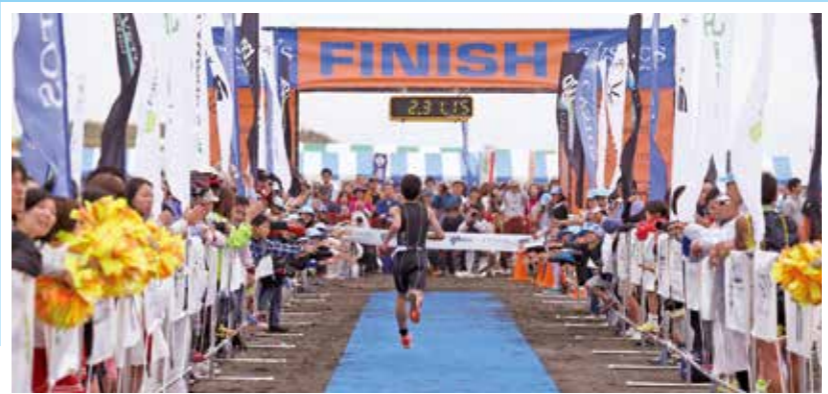
③ラン 10km ビーチサイドラン