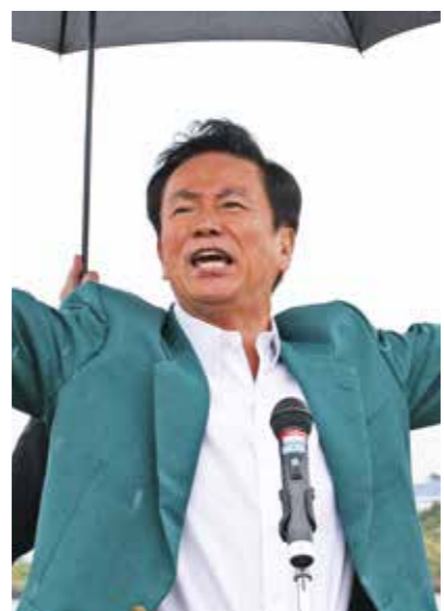
★大会名誉会長 千葉県知事