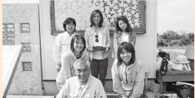
▲私たちが釣ヶ崎海岸広場エコトイレ清掃ボランティアのメンバーです。