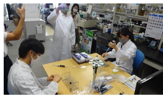
公益財団法人かずさDNA研究所