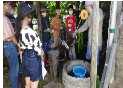
県環境研究センター 地質環境研究室