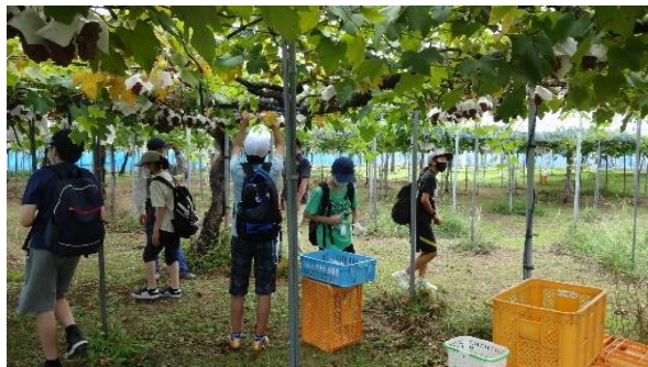
千葉大学環境健康フィールド科学センター