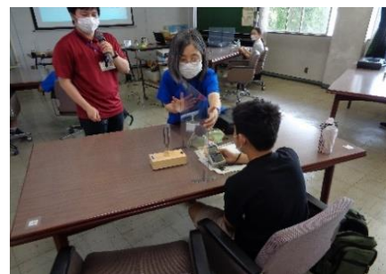
県環境研究センター 大気騒音振動研究室