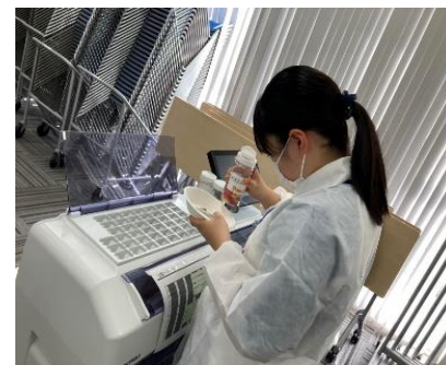
株式会社MCCマネジメント (マツキヨココカラ&カンパニー)