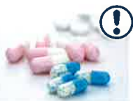
医薬品の多量摂取