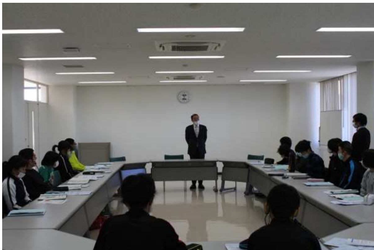
▲長生特別支援学校の生徒さんに挨拶をする町長

長生特別支援学校高等部1年生の校外学習が役場で行われました。 一宮町のオリンピックに向けた取り組みなどを一生懸命に調査・研究していました。