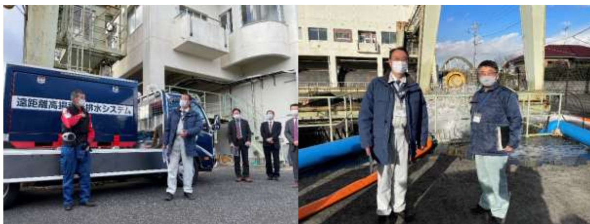
▲デモンストレーションと挨拶の様子