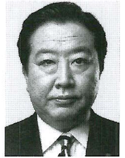
立憲民主党 代表 野田佳彦