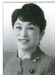
社民党党首 福島みずほ