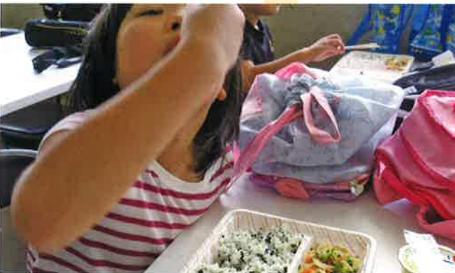
放課後児童クラブに通う子供たちにお弁当をお届けする「楽々 kids ランチ」を開催しました。【睦沢町】