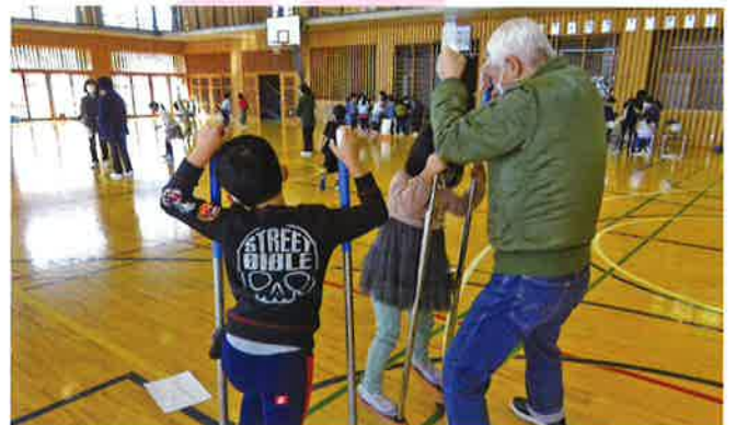
地域の小学生と高齢者が竹馬やおはじきなどの「昔遊び」を通じて交流しました。【長南町】