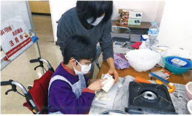
アドバイザーが中心となり、身体に障がいのある方たちへの就労相談や自立支援を行っています。【千葉市】