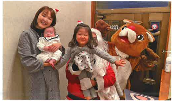
お子さんがいる家庭をボランティアが訪問して交流し、「地域での子育て」を行っています。【御宿町】