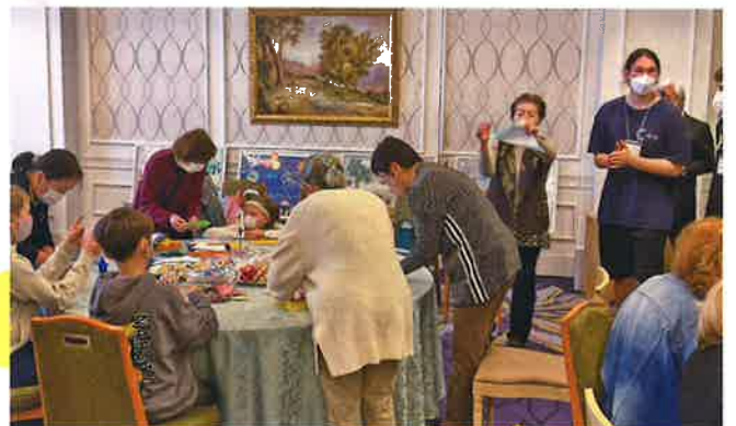
ウクライナから避難してきた方々が集う場を開催し、日本で生活を支援しています。【千葉市】