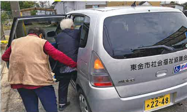
高齢者や障がいなどのために、公共交通機関での移動が困難な方の外出をサポートしています。【東金市】