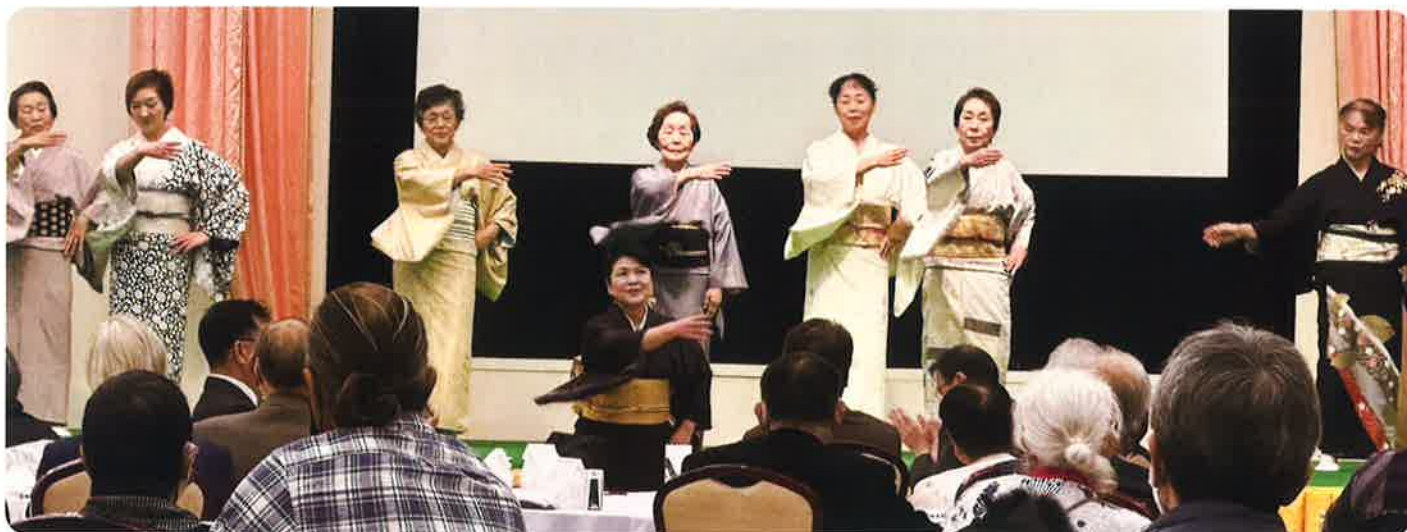
寿扇会の皆さん 民舞(東浪見地区)