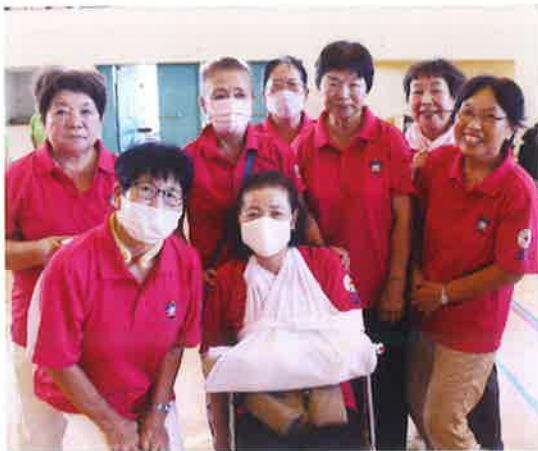
三角巾と副子を使って上手にできました