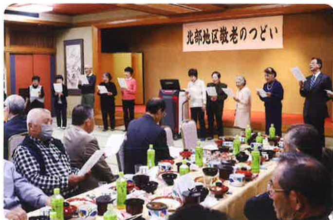
皆さんで歌いましょう(北部地区)