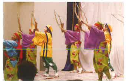
生涯大学の皆さん 南京玉すだれ（市街地区）

一宮町では、町内5地区の地区社会福祉協議会有り、10月17日から11月30日までの間に各地区社協主催の敬老のつどいが開催されました。 各地区社協、地域の75歳以上の方を対象に昼食を食べながら、落語を聞いたり、カラオケをしながら様々な催し物を楽しみ交流をしていました。