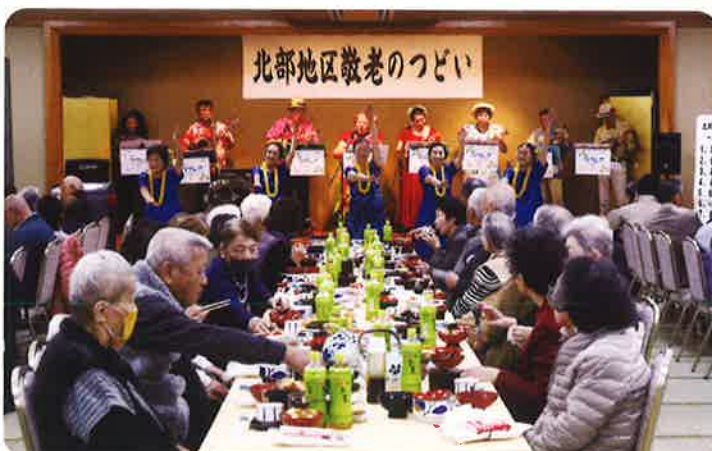
モアニフラ、ラウレアの皆さん フラダンス、ウクレレ(北部地区)