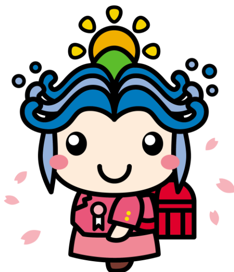
一宮町キャラクター 一宮いっちゃん

記載内容につきましては、令和4年10月現在での情報となります。見直し検討中の項目もあるため、変更内容については改めてお知らせします。