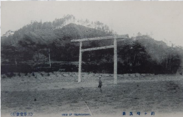
▲絵葉書「釣ヶ崎真景」(個人所蔵)