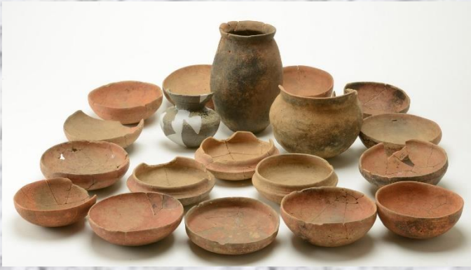
▲待山遺跡出土遺物（町教委所蔵）