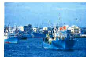
7/3 ① 鏡子漁港