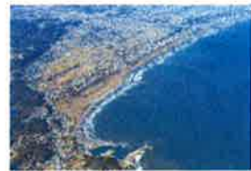
7/2 ④ 釣ヶ崎海岸