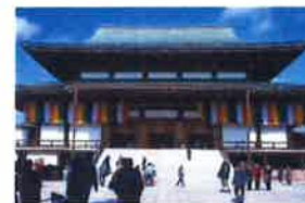
7/3 ⑤ 成田山新勝寺