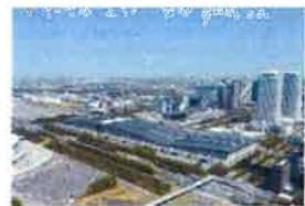
7/3 ⑥ 幕張メッセ周辺