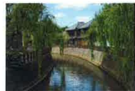
7/3 ③ 小野川周辺