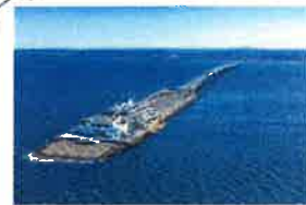
7/2 ① 海ほたる