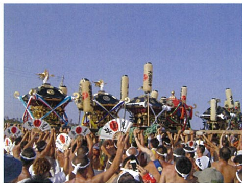
上総十二社祭り(はだか祭り)