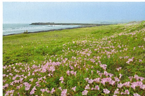
九十九里浜一帯に広がるハマヒルガオ