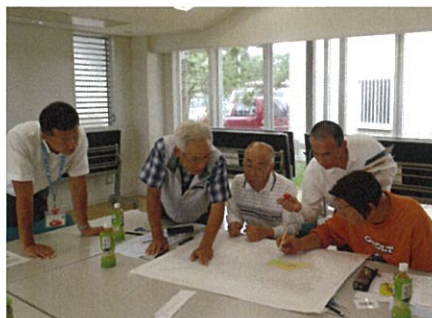
東浪見地域懇談会