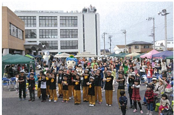
新庁舎内覧会での「一宮町恋するフォーチュンクッキー」