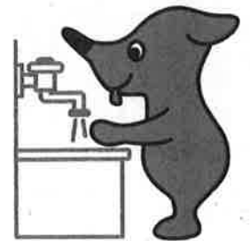
千葉県PR マスコットキャラクター