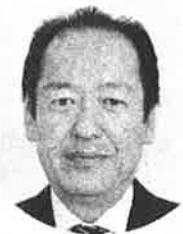
戸羽 太陸前高田市市長