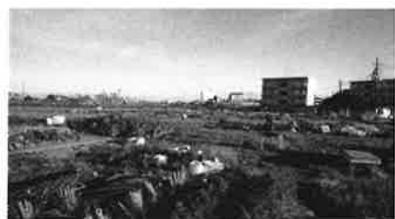
景色のよい一宮町市民農園