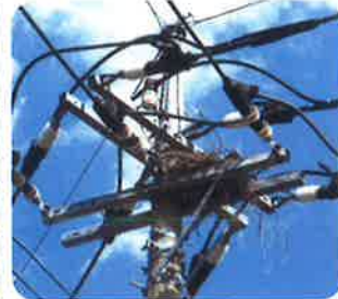
カラスの巣がある