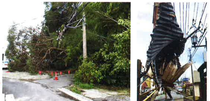
2019年台風15号襲来時の実際の被害の様子

ビニールやトタン、 樹木等が電線に引っかけると 長期間の停電の原因になる 場合があります