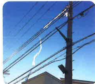
電線にビニールが 引っかかっている