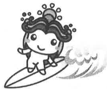
一宮町キャラクター「いっちゃん」