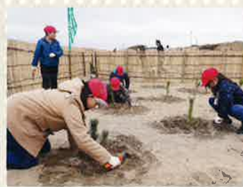
旭復興事業2017・植樹(旭市)

津波被害等が甚大な海岸林において、緑の募金中央事業として、市町村と連携した植樹等を行っています。