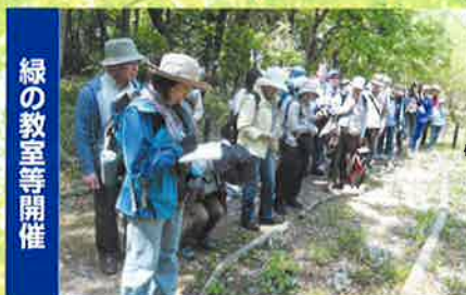
緑の教室等開催 みどりの重要性を普及・啓発します こんぶくろ池・春の自然観察会(柏市)