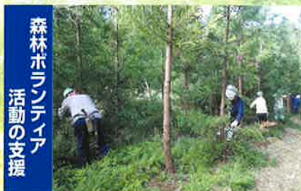
森林ボランティア活動の支援 ボランティアによる森づくりを応援します 県民参加による緑の再生事業・人工林の枝打(富津市)