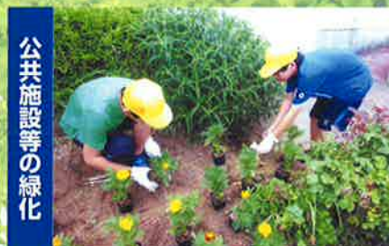
公共施設等の緑化 私たちの街にみどりをありがとう 学校の緑化活動(佐倉市)