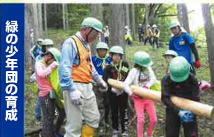
緑の少年団の育成 未来のみどりは僕たち私たちが守り育てます 第37回緑の少年団交流集会・体験林業(大多喜町)

緑の募金は身近な環境の緑化から、森林の整備、緑の普及啓発事業、森林環境学習など様々な緑化事業に役立っています。(写真はその一例です)