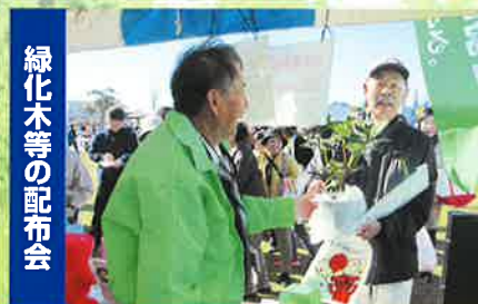
緑化木等の配布会 家庭からのみどりづくりを推進 旭市産業まつりでの配布会(旭市)