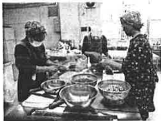
福祉ボランティア活動