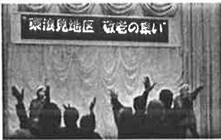
地区社協敬老のつどい