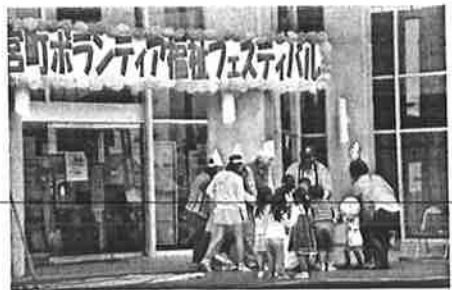
ボランティア福祉フェスティバル開催