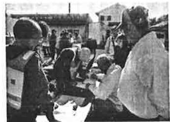
災害ボランティア立上げ訓練