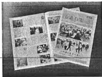
福祉広報「しあわせ」