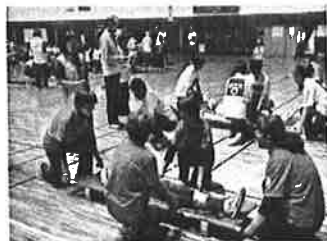
日赤奉仕団の活動