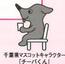
千葉県マスコットキャラクター 「チーバくん」

長生健康福祉センター健康生活支援課へ お問い合わせください。 ☎0475-22-5167