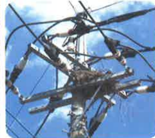
カラスの巣がある