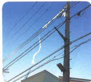
電線にビニールが 引っかかっている