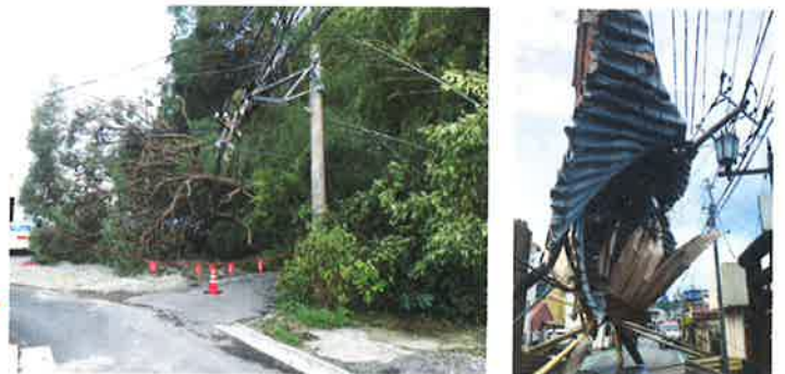
2019年台風15号襲来時の実際の被害の様子

ビニールやトタン、 樹木等が電線に引っかかると 長期間の停電の原因になる 場合があります