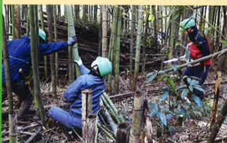
県民参加による緑の再生事業・竹の整理伐作業(千葉市)