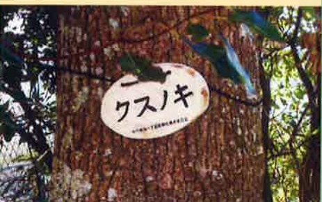
樹木ラベル取付け運動(茂原市ほか)