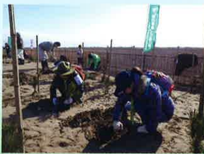
山武市復興植樹祭(写真は平成30年3月実施)

潮害、飛砂・風害防備等の災害防止機能を有する海岸林は、三方を海に囲まれた千葉県において、極めて重要な森林です。津波被害等が甚大な海岸林において、緑の募金中央事業として、市町村と連携した植樹等を継続して行っています。