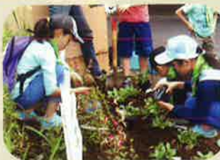
千葉瑞穂みどりの少年団

緑の少年団活動が一層、広まりますよう、結成に御関心の際は、ぜひ緑化推進委員会まで御一報ください。