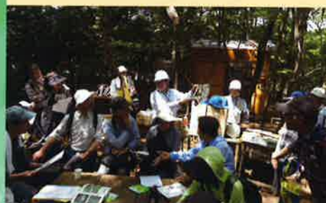
森めぐりツアー(松戸市ほか)

緑の募金は身近な環境の緑化から、森林の整備、緑の普及啓発事業、森林環境学習など様々な緑化事業に役立っています。(写真はその一例です)