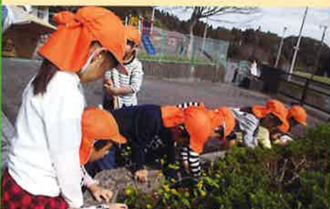
保育園での緑化活動(いすみ市)