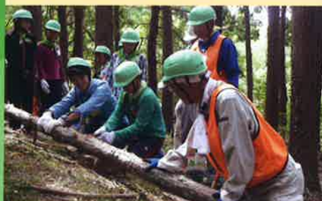
第38回緑の少年団交流集会・体験林業(大多喜町)