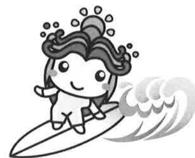
一宮町キャラクター「いっちゃん」