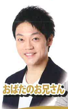
おばたのお兄さん