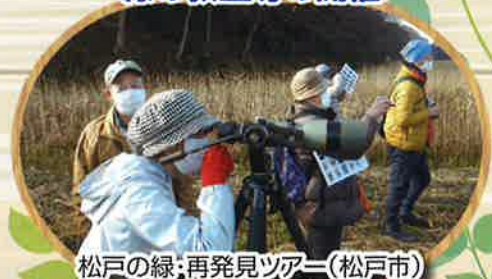
松戸の緑：再発見ツアー(松戸市)