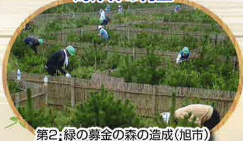
第2：緑の募金の森の造成(旭市)