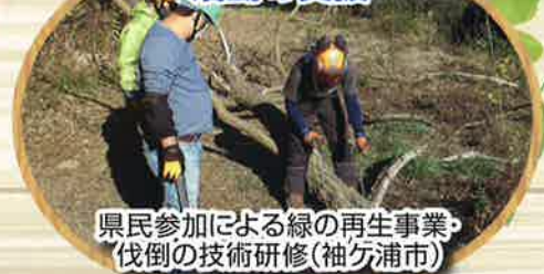
県民参加による緑の再生事業・ 伐倒の技術研修(袖ヶ浦市)