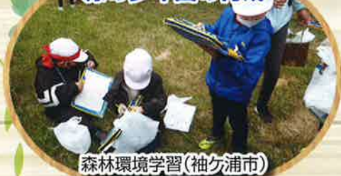
森林環境学習(袖ヶ浦市)