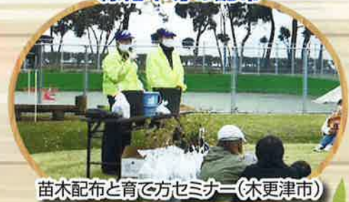
苗木配布と育て方セミナー(木更津市)