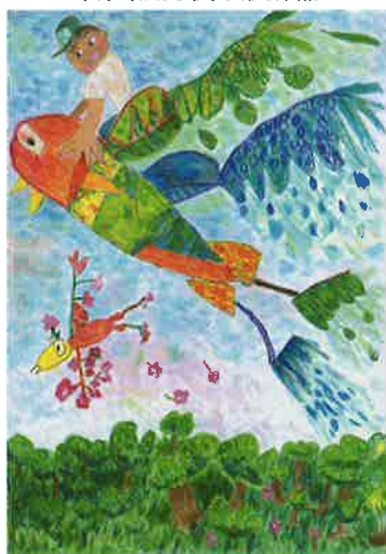
作：藤井一鷹さん(小2・千葉県在住)