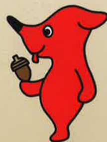
千葉県PRマスコット キャラクター「チーバくん」 千葉県許諾第A1072-7号

みどり豊かで安全な暮らし、そして、持続可能な地球環境を、県民の皆様と一緒に支えていただきたく、緑の募金に御協力をお願いいたします。