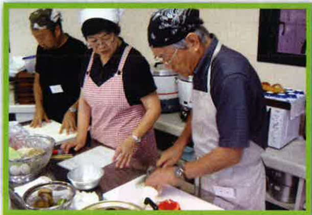
男の料理教室／(御宿町)

男の料理教室は、料理の他に、健康や栄養のことまで学べる所が人気で、高齢者が元気で過ごせる町作りに役立っています。また、この教室に参加した受講生の皆さんが、 地域へ参加するきっかけ にもなり生きがい作りにもひと役買っています。