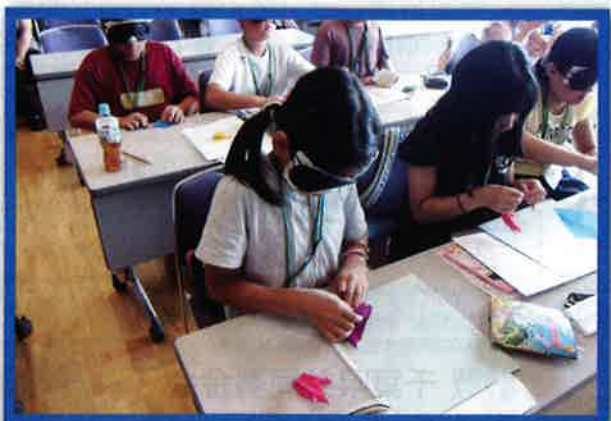
福祉体験教室／(我孫子市)

毎年夏休みに小学生福祉体験教室を開催しています。写真は、視覚障がい者体験で、アイマスクを着けて、折り紙を折っているところです。共同募金は、 子ども達の心を育む活動 にも使われています。