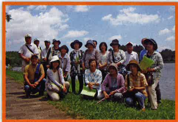
福島県からの避難者交流会／(わかば「お茶っこ」しよう会)

たくさんの避難者の方々とお会いできておしゃべりが出来ました。皆さんにとって良い息抜きになったと思います。苦悩や楽しみ、今後についても聞けてよかったです。 このような機会をくださった寄付者の皆さまに心より感謝申し上げます。