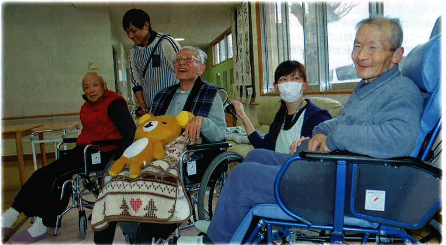
リクライニング車いすを購入したことで、快適で安全な生活を維持することができます。(特別養護老人ホーム/多古町)

平成28年度の共同募金に6億9008万円余りのご協力をいただきありがとうございました。