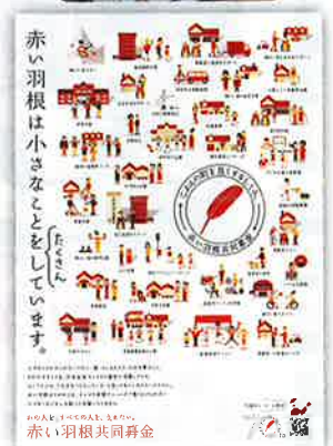
平成29年度 赤い羽根共同募金ポスター