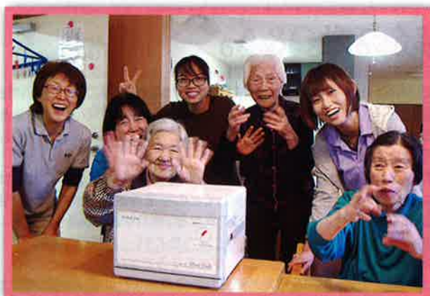
高齢者施設への備品購入／(千葉市)

新しいタオルウォーマーをいただき、入居者様に気持ち良く清拭をしていただけるので、職員も大変喜んでおります。 みんなで大切にに使わせていただきます。 本当にありがとうございました。