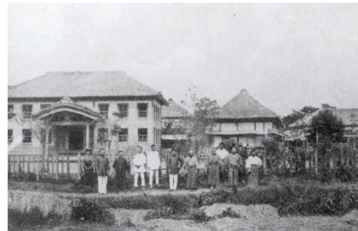
東浪見尋常高等小学校 (大正11年)