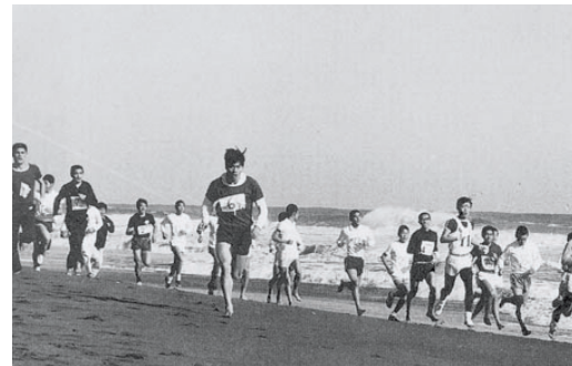
元旦那ぎさマラソン