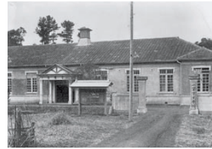
一宮実業学校 (旧一宮病院)