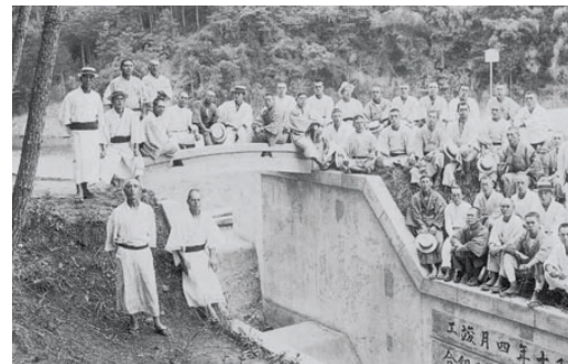
昭和初期の耕地整理