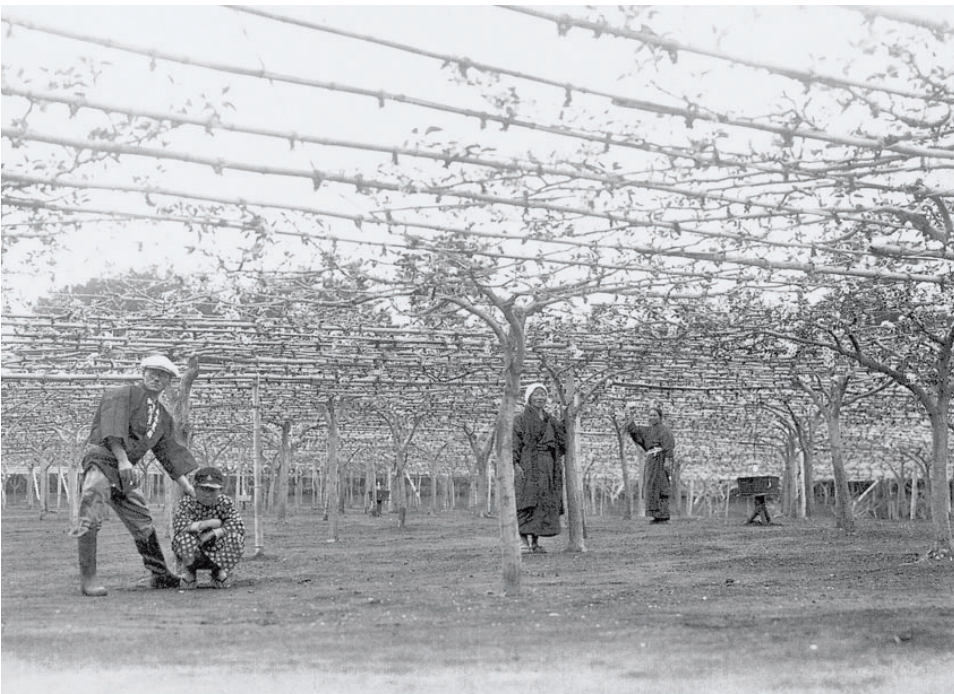
昭和はじめ頃の梨畑