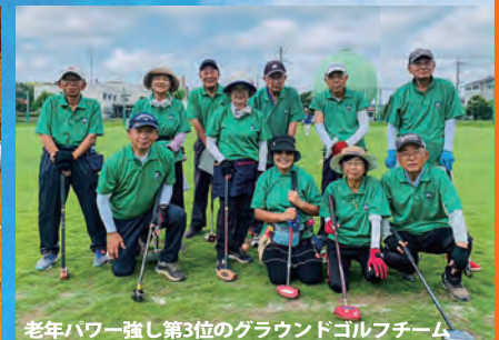
老年パワー強し第3位のグラウンドゴルフチーム