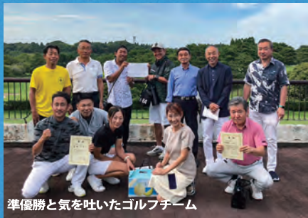
準優勝と気を吐いたゴルフチーム