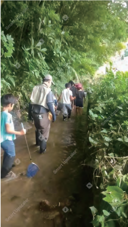
▲みんなで川の生き物を探索中

その後、みんなで川の中を歩きながら網で生き物を探しました。すると、ドジョウ、ヨシノボリ、ヤゴ、テナガエビ、アメリカザリガ