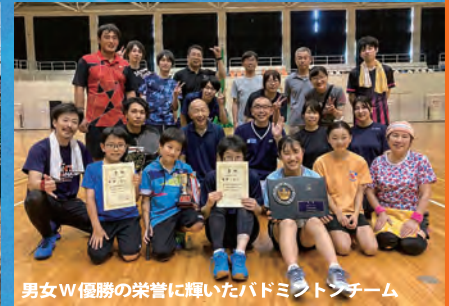
男女W優勝の栄誉に輝いたバドミントンチーム