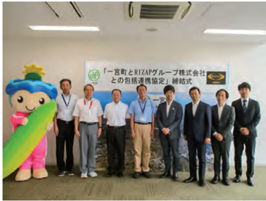
▲締結式でのフォトセッション