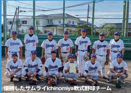
優勝したサムライIchinomiya軟式野球チーム