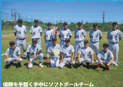
優勝を手堅く手中にソフトボールチーム