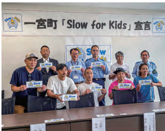
▲本宣言の賛同者とのフォトセッション