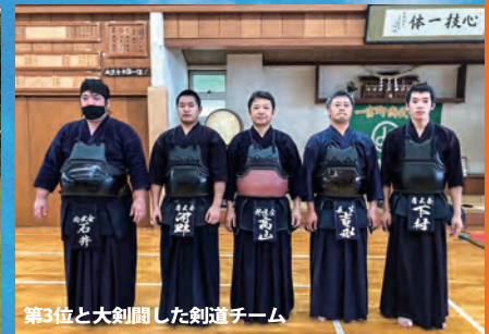
第3位と大剣闘した剣道チーム