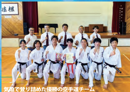
気迫で登り詰めた優勝の空手道チーム