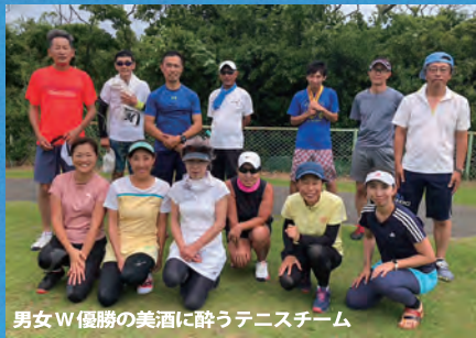
男女W優勝の美酒に酔うテニスチーム