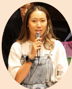
▲まいまいですやんさん

地域の人などで協力して育てているような感じがします。一宮の人の温かさを次世代に繋ぎたい。移住したての時から手を差し伸べてもらいました。」と、移住者ならではの視点で語りました。