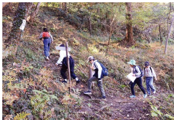
▲いこいの森から自然の家までウォークラリー