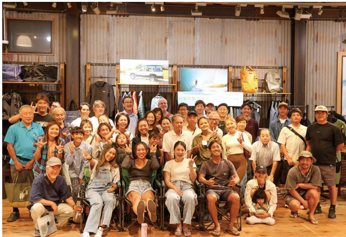
▲ゲストトーク、参加者との集合写真