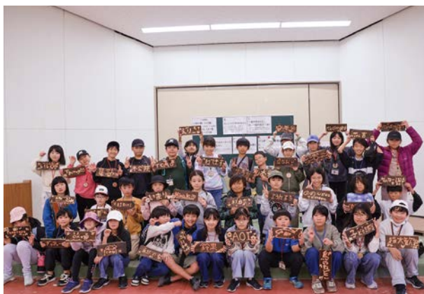
▲自然の家での体験学習（焼き板づくり）