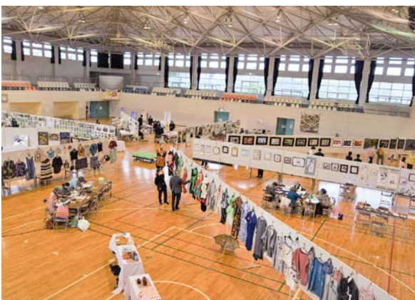
▲展示と体験を行った文化祭

今回は、長生特別支援学校と一宮商業高校が初参加。商業の電算部はプログラミングのゲーム、商品開発チームは、バスボム作り体験で、来場者を惹きつけました。2日間で約500人の観客が訪れ、さまざまな芸術文化を堪能しました。