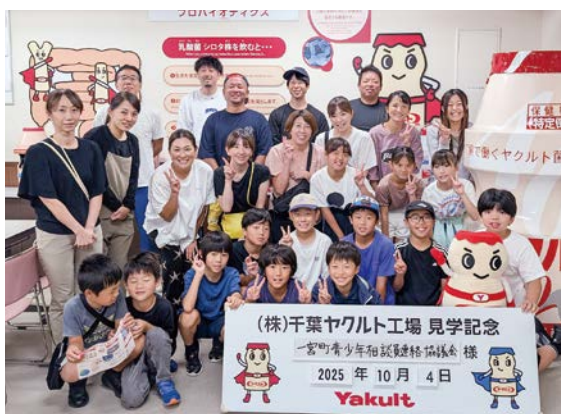
▲ヤクルト工場での集合写真

一宮町青少年相談員連絡協議会では、10月4日に「ヤクルト工場＆千葉市動物公園へ行こう！」を開催しました。当日は26人の親子が参加し、午前中は馴染みのあるヤクルトの製造過程を見学し、午後は千葉市動物公園で、各々の時間を過ごしました。今後子どもたちが楽しめる事業を計画していきます。事業が決まり次第、学校を通じてお知らせしますので、ご参加をお待ちしています。