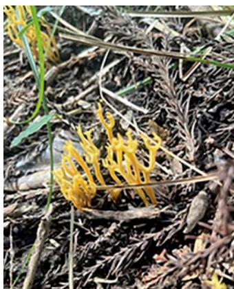
▲ニカワホウキタケ