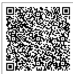
▲ホームページ （取扱店舗一覧）