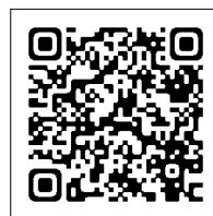
▲津波ハザードマップ