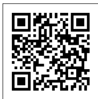
▲環境省ホームページ

※蛍光灯の生産と輸出入が終了するということであり、使用が制限されるわけではありません。詳細は、環境省ホームページをご覧ください。