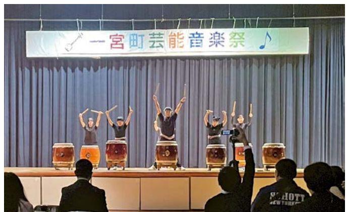
▲息のそった太鼓演奏