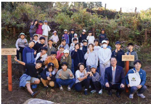
▲いこいの森での集合写真

本イベントは、令和5年度に市川市と締結した「森林整備等に関する協定」に基づくものであり、今後も継続して実施していく予定です。