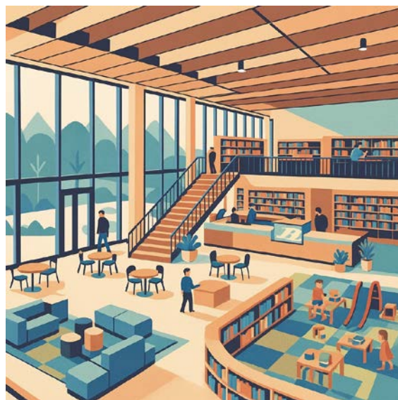
▲イメージ図です。施設のデザインや内容はこれから議論して決定します。

複合施設とは、社会教育や生涯学習を目的とした現公民館と図書館や自習室、子ども子育て支援施設など、違う目的で設置された複数の機能を持ち合わせた施設をいいます。