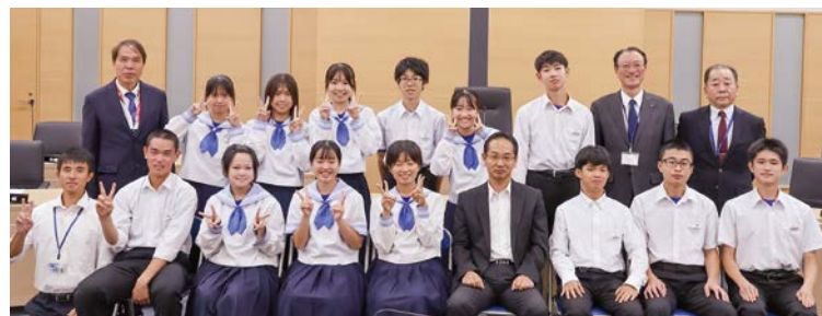
▲中学生議員13人と左から叶内教諭、教育長、町長、副町長、後藤校長

分かりやすくとっても良い質問と答弁だった。 ・自習室やGPSセンターの裏山、体育館のエアコンなど、気になっていることがたくさん知れて良かった。 ・町長が大切にしている「現場に向く」という話で、私は実際に自分の目で見ないと分からないものは多くあると思っており、こういった想いを知り、普段から町のことをしっかりと考えて仕事してくださっていると感じた。 ・地方公共団体がどのように政治を行っているかという行政の仕組みを知ることができた。